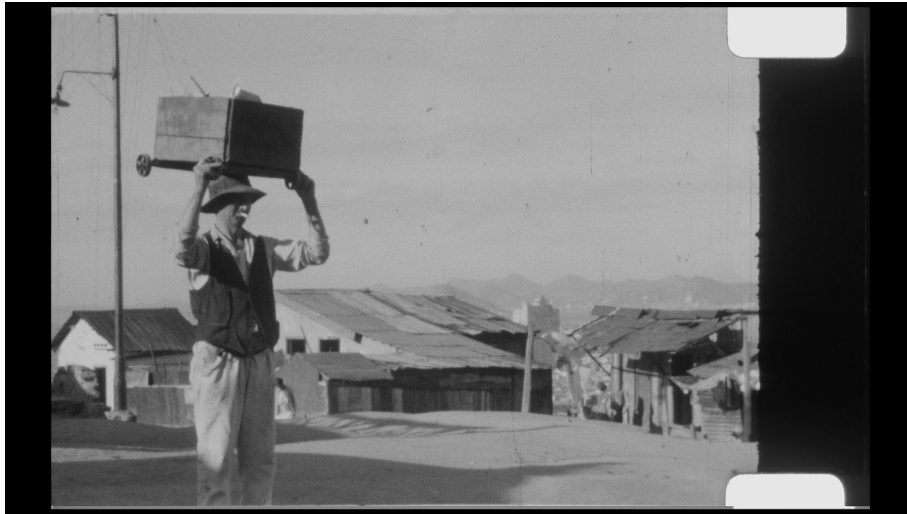
Le Corbusier, Rio de Janeiro, Favela Santa Teresa, photographie, 1936, séquence 107364